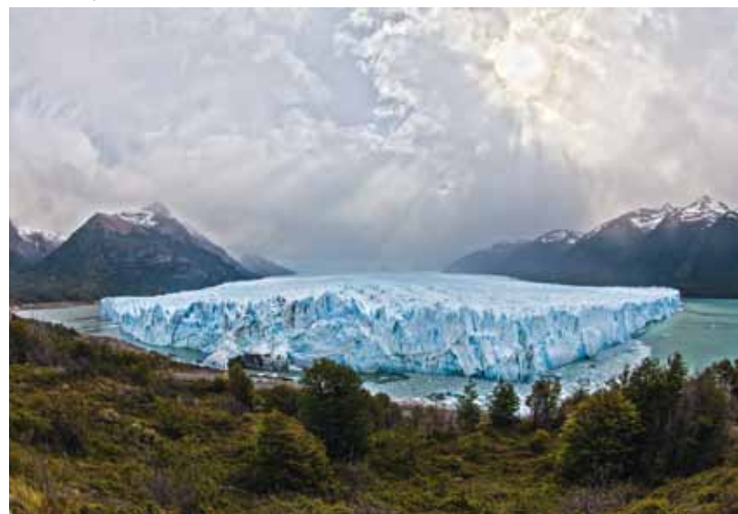
Der Perito-Moreno-Gletscher in Argentinien. Mit sehr effizienten Batteriespeichern lässt sich das Klima schützen.